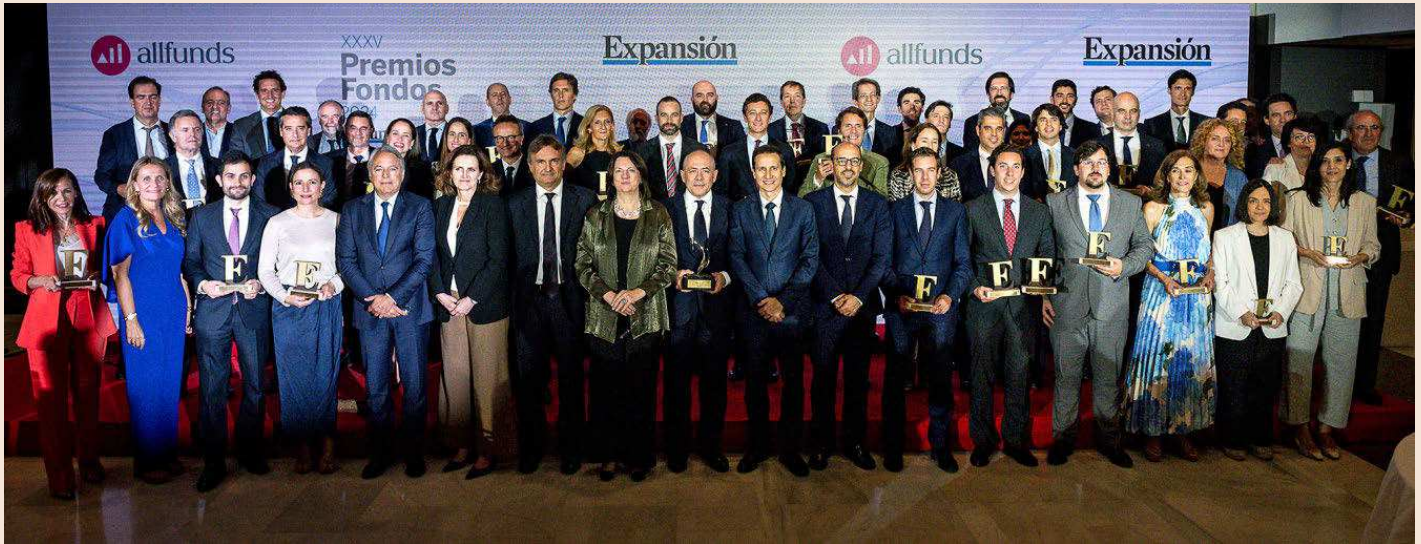
Foto con todos los premiados en la XXXV edición de los Premios de Fondos de Inversión.