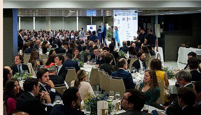
Vista general del encuentro que reunió a más de 450 profesionales del sector de la gestión de activos.