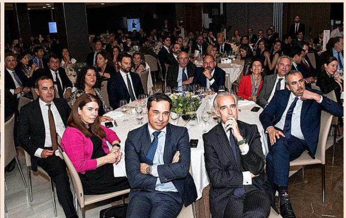
Las mesas del jurado de los premios, compuesto por los primeros ejecutivos de las mayores gestoras de fondos nacionales e internacionales con presencia en España.