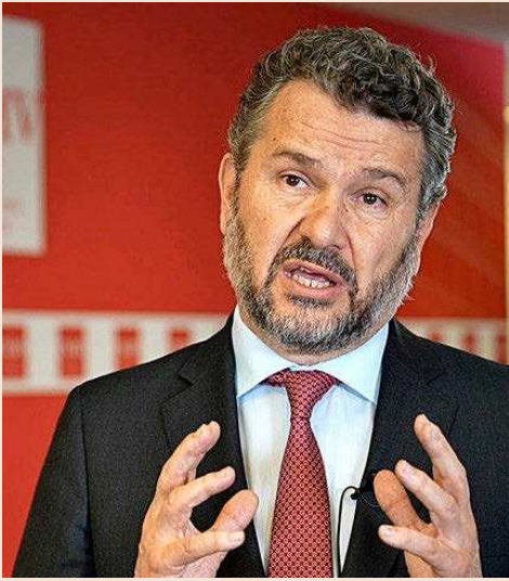
Rodrigo Buenaventura, presidente de la CNMV, en su intervención durante la ceremonia de los premios.